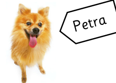
un perro que se llama Petra