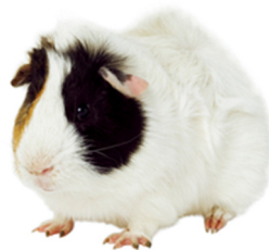
una cobaya un conejillo de Indias